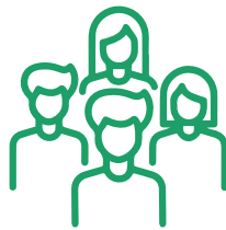
Sport pour toutes et tous